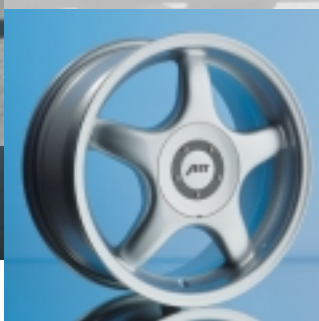
Abt Sportfelge A13