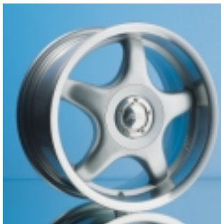
Abt Sportfelge A22

Sportfelgen vom Abt werden Sie begeistern. Und überzeugen. Das typische Fünf-Speichen-Design, das bestechende Finish in Qualität und Optik. Optimales Gewicht gewährleistet bestmögliches Handling – dafür stehen wir mit unserem Namen. Abt.