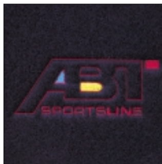
Abt Fußmatten Mit gesticktem Logo.