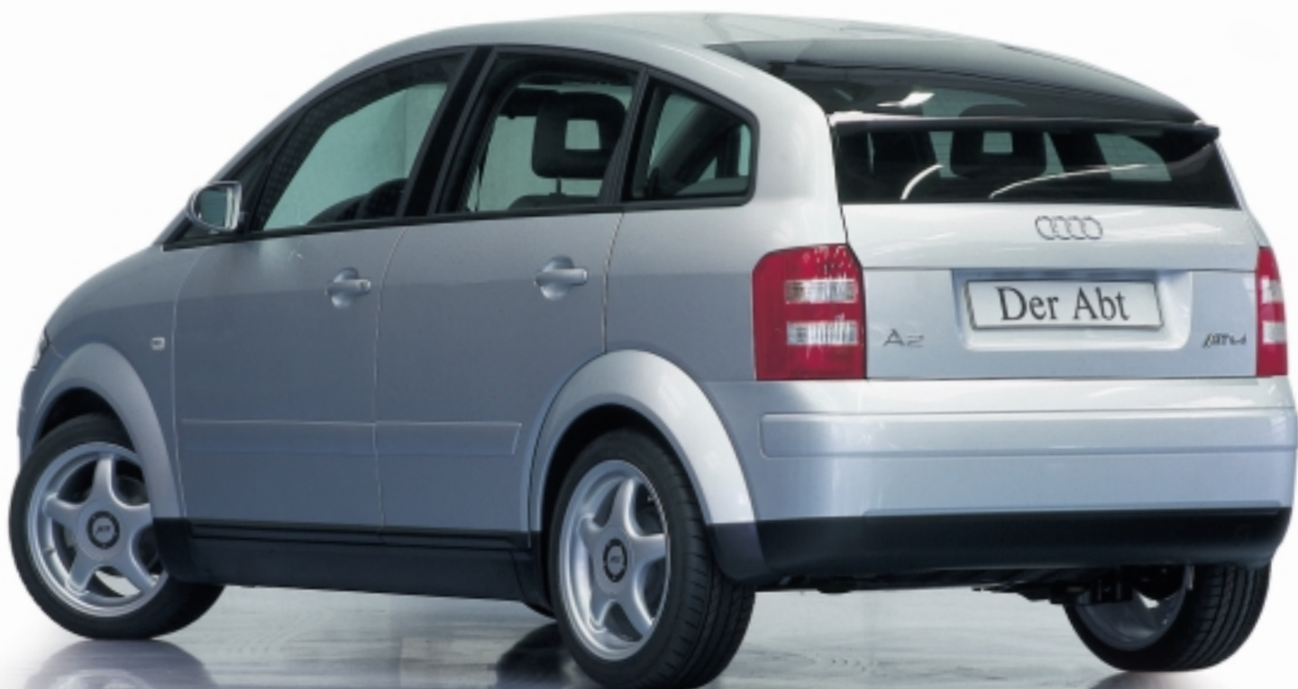
Abt A2 mit Sportfelge A13

So viel Sport muss sein. Der Abt in der DTM 2001.