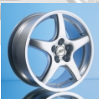
Abt Sportfelge Z1/Z3

7 x 16 ET 38 bzw. 7,5 x 17 ET 38 einteilig gegossen