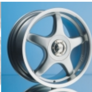
Abt Sportfelge A23