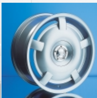
Abt Sportfelge V1