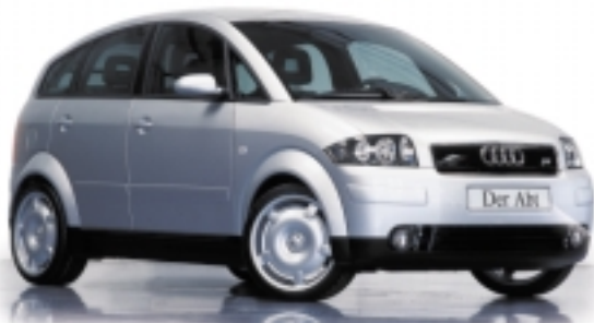
Abt A2 mit Sportfelge V1