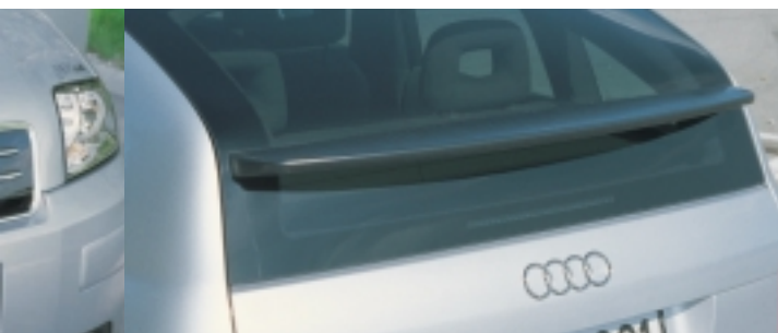
Abt Aluminium Set

Schaltknäuf, Schaltkulissenring und Hülse für Handbremshebel