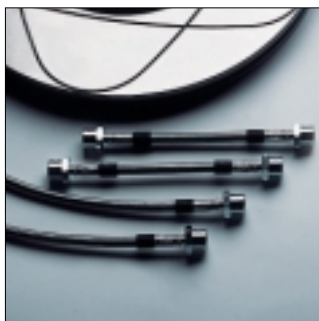
Abt Stahlflexbremsleitungen Kompletsatz für vorne und hinten. Immer optimaler Druckpunkt, weniger Fading, weniger Pedalkraft, optimaler Schutz gegen Steinschlag und Scheuern, hervorragende Dosierbarkeit.