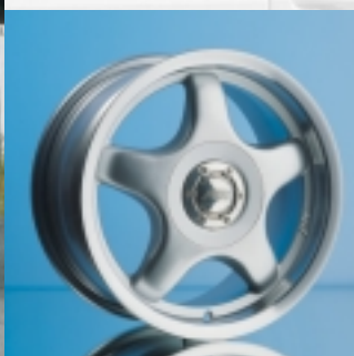
Abt Sportfelge A21