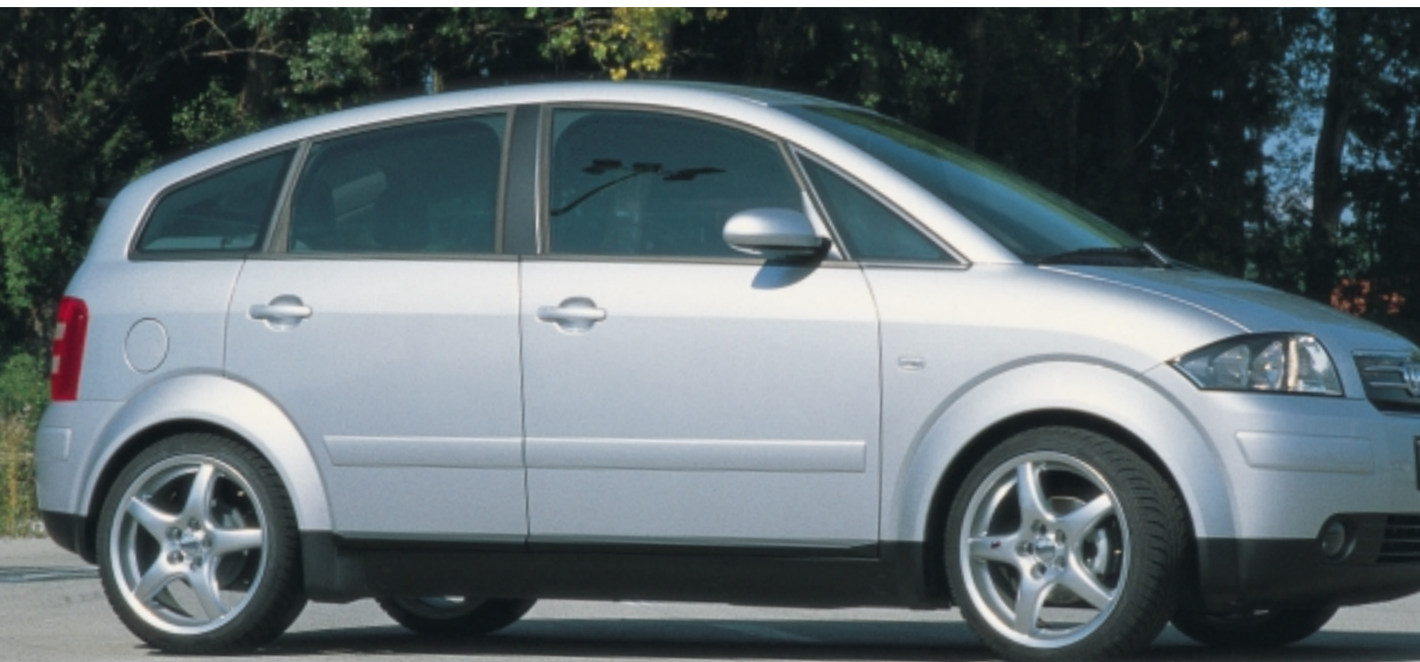
Abt Sportfelge Z3, 7,5 x 17

Kein Auffallen um jeden Preis, sondern wohltuendes Abheben von der Menge – das sind die Ziele, die Abt mit seinem Zubehörprogramm für den A2 verfolgt. Die klassischen Abt Sportfelgen im Fünf-Speichen-Design, dezente optische Elemente, Fahrwerk und Aluminium-Interieur geben dem kleinsten Audi das besondere Etwas mit auf den Weg.