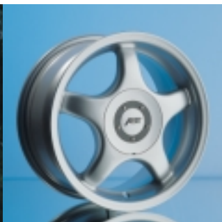
Abt Sportfelge A15